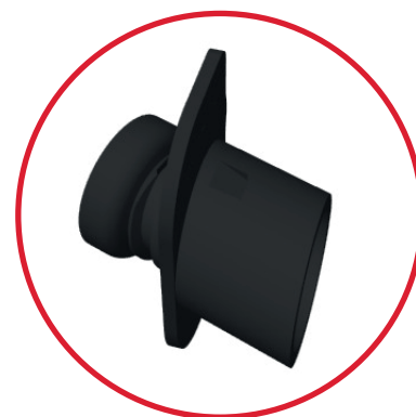
ACP 50539 Regolo obliquo in nylon per turbovite

Fresa ACP 50535 dedicata al regolo ACP 50539