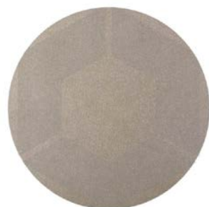
DISCO A STRAPPO DIAM.115