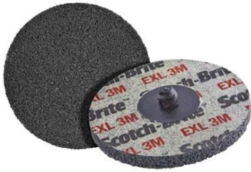
DISCO DIAMETRO 75 MM