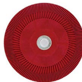
PLATORELLO DIAM. 115 PER DISCO FIBRATO