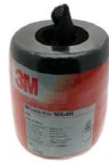
TAMPONE MANUALE MULTIFLEX