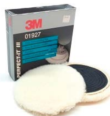
CUFFIA IN LANA BIANCA