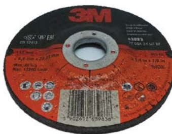
DISCO DA TAGLIO PER INOX