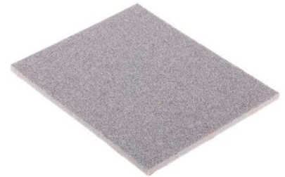
TAMPONE MANUALE SPUGNA ABRASIVA