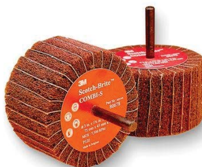
SPAZZOLA LAMELLARE ABRASIVA

Uso: operazioni di finitura a macchina su parti piane in acc. inox