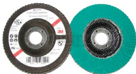
DISCO LAMELLARE DIAM. 115 577F GRANA P40 PER FERRO