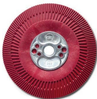
PLATORELLO 14MA DIAM.115 art. 8746