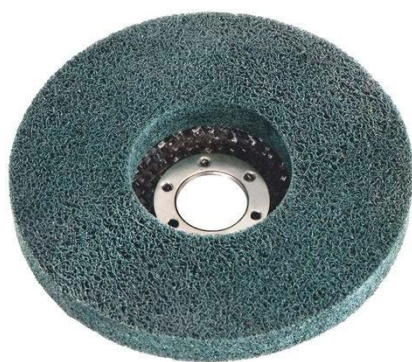
DISCO COMPRESSO T27 GRANA FINE

Uso: abbassamento di cordoli di saldatura smerigliatura acciaio e acciaio inox