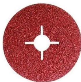
DISCO FIBRATO DIAM. 115X22 982C

Uso: pulitura o ripresa di satinatura a macchina su piccole superfici in Acciaio