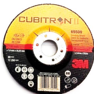
DISCO SBAVO CUBITRON II

Uso: abbassamento di cordoli di saldatura