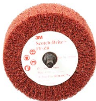
SPAZZOLA SCOTCH BRITE ATTACCO ROLOC 63X32 GRANA FIN