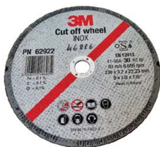
DISCO DA TAGLIO PER INOX T41