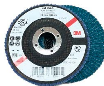
DISCO LAMELLARE DIAM. 115 577F GRANA P40 PER FERRO

Uso: sbavatura e asportazione pesante di materiali duri e molto duri, in particolare acciaio e acciaio inox