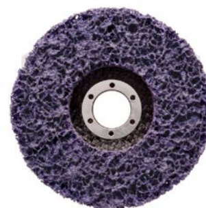
SPAZZOLA CLEAN AND STRIP art. 92371