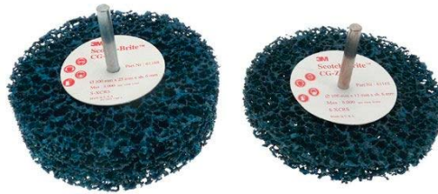
SPAZZOLA DIAMETRO 100X13