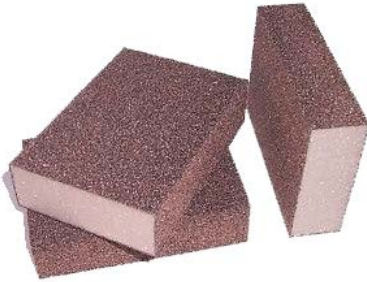
SPUGNA ABRASIVA per lavorazioni manuali su acc.inox